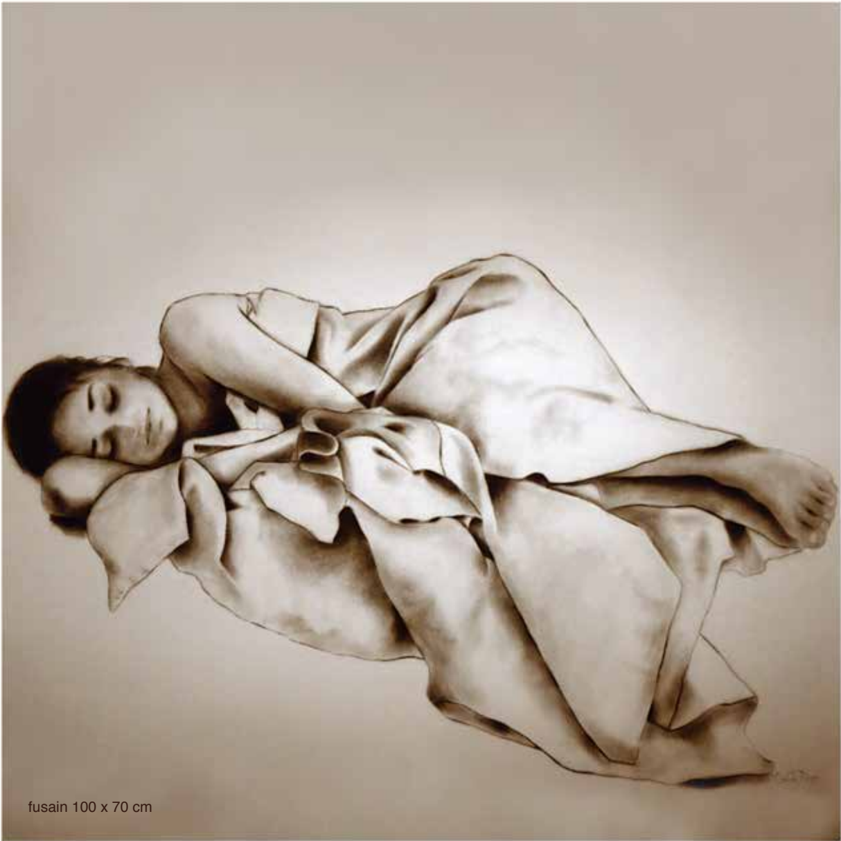
fusain 100 x 70 cm