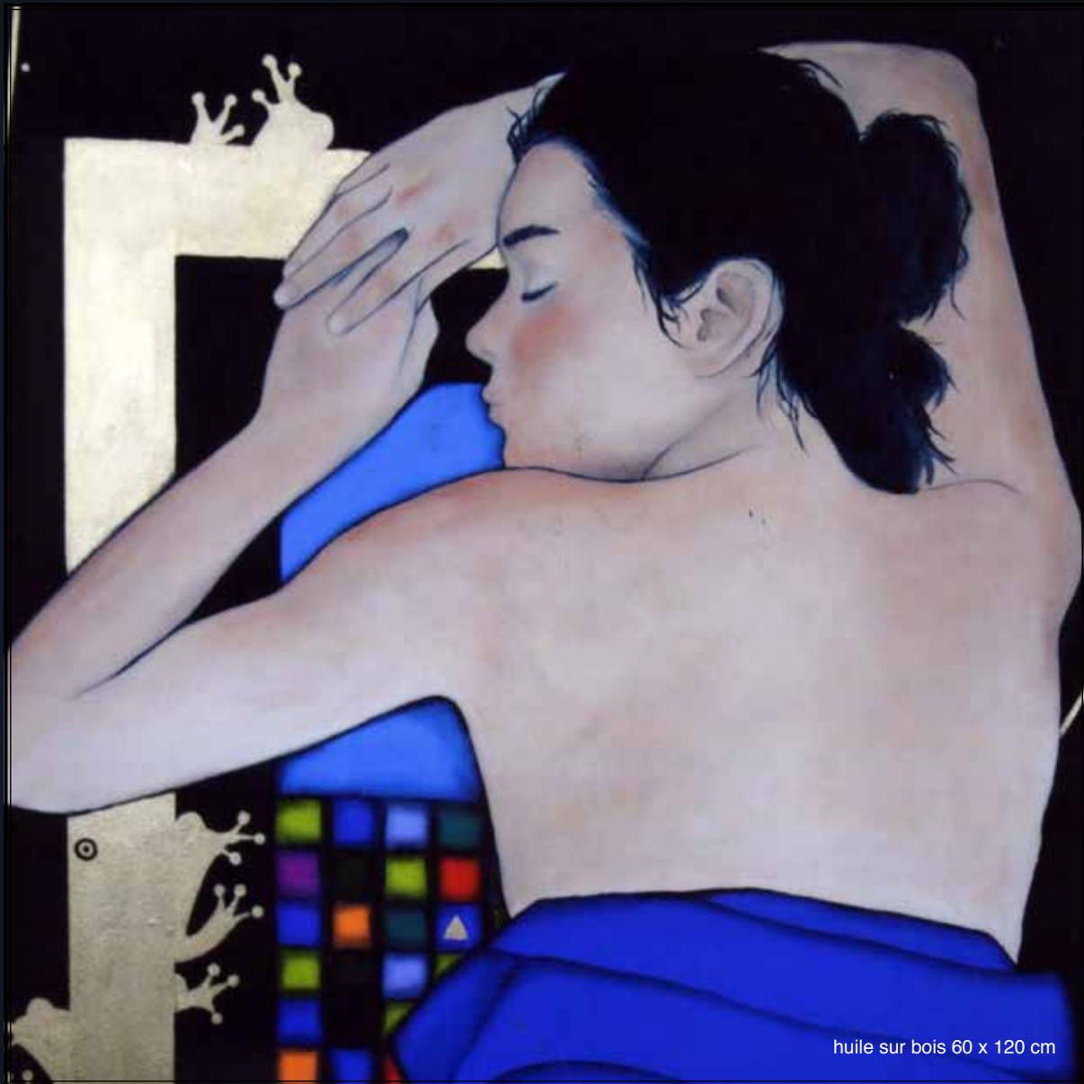
huile sur bois 60 x 120 cm